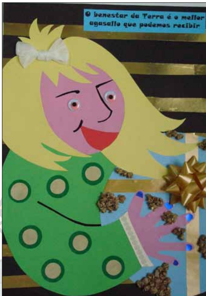
CPI de Cova Terreña (Baiona, Pontevedra)

Mi traballo representa que la tierra puede ser un regalo si todos colaboramos y aportamos algo para mantenerla limpia, sin contaminación y así poder disfrutar de ella sin problemas.