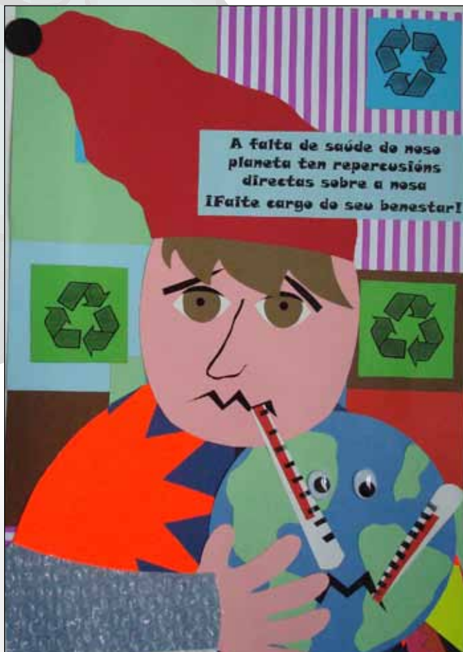
CPI de Cova Terreña (Baiona, Pontevedra)

Que a terra aparte de que co paso do tempo vaia a peor, tamén empeoramos con ela nós