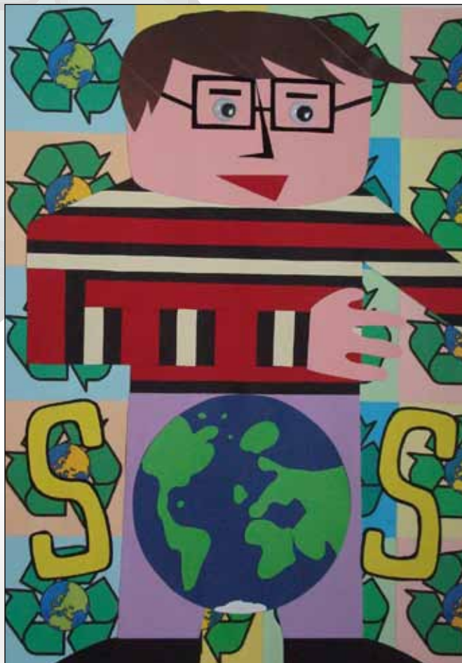
CPI de Cova Terreña (Baiona, Pontevedra)

Representa a chamada de auxilio da terra a través do símbolo SOS