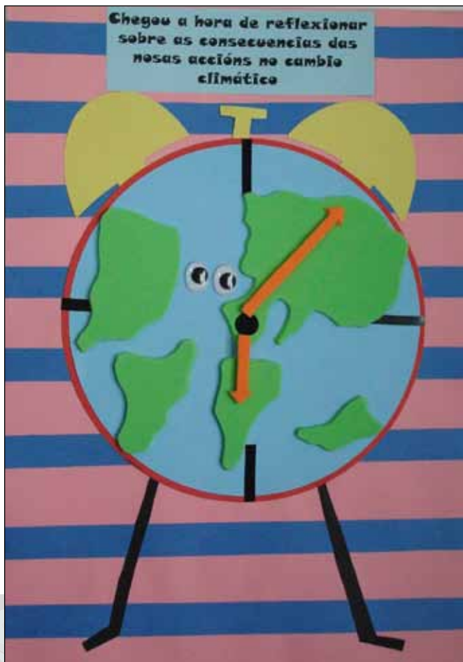
CPI de Cova Terreña (Baiona, Pontevedra)

Representábase o planeta terra dentro dun reloxo, isto significa que é a hora de axudar ao noso planeta.